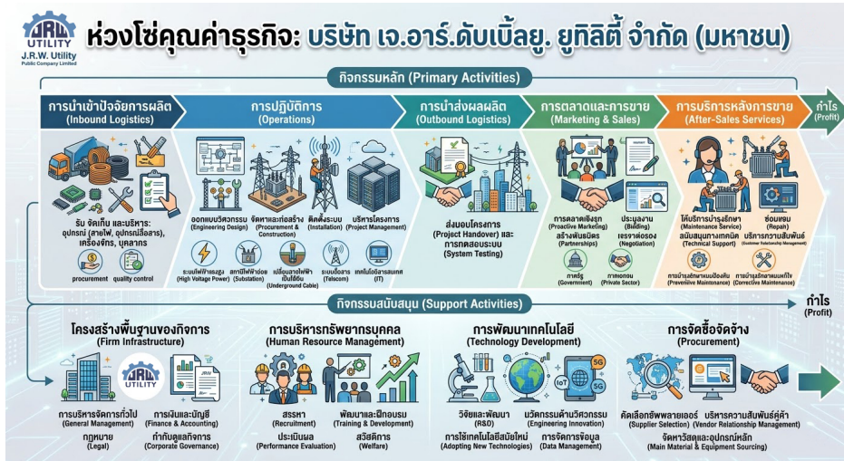
ห่วงโซ่มูลค่าธุรกิจ