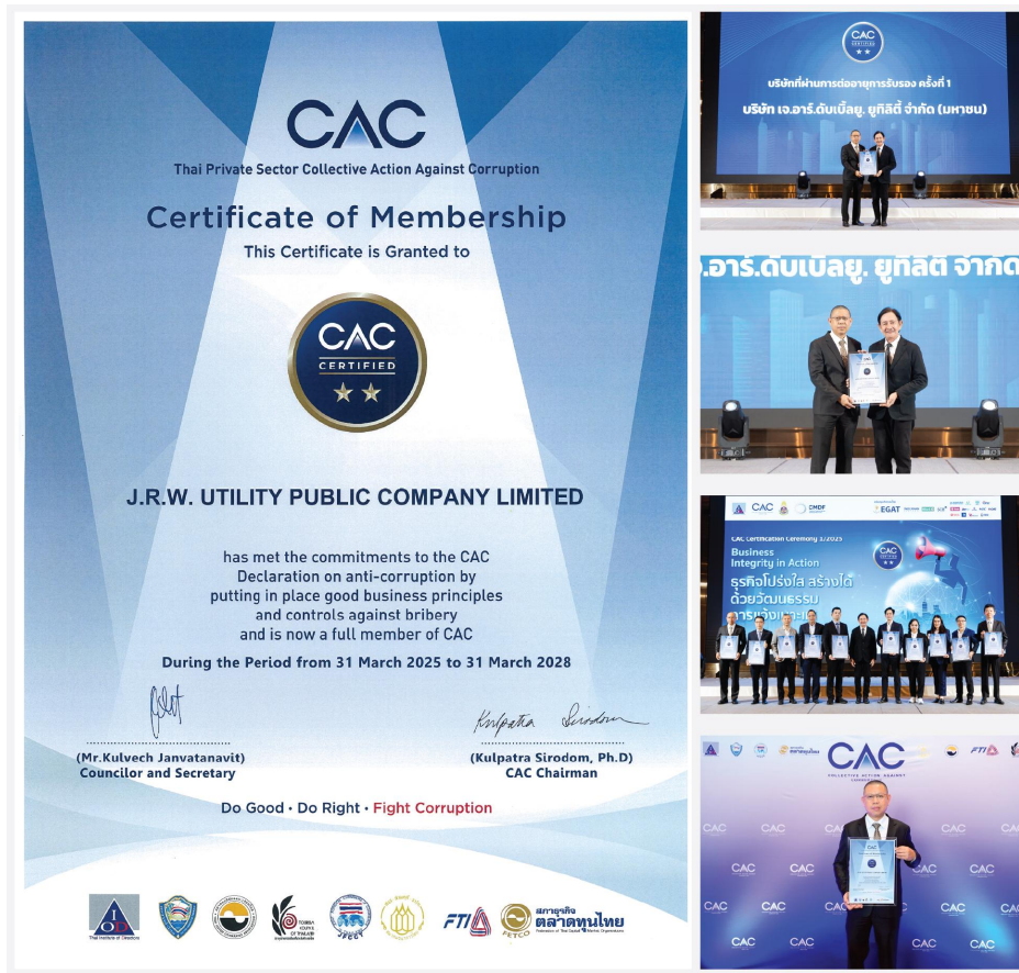
ต่ออายุครั้งที่ 1