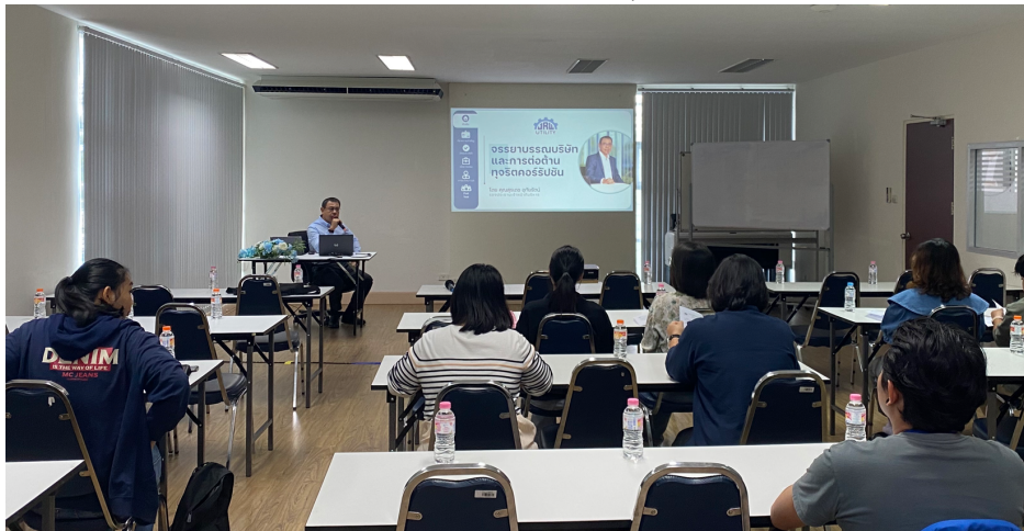
อบรมจรรยาบรรณและการต่อต้านทุจริตคอร์รัปชัน