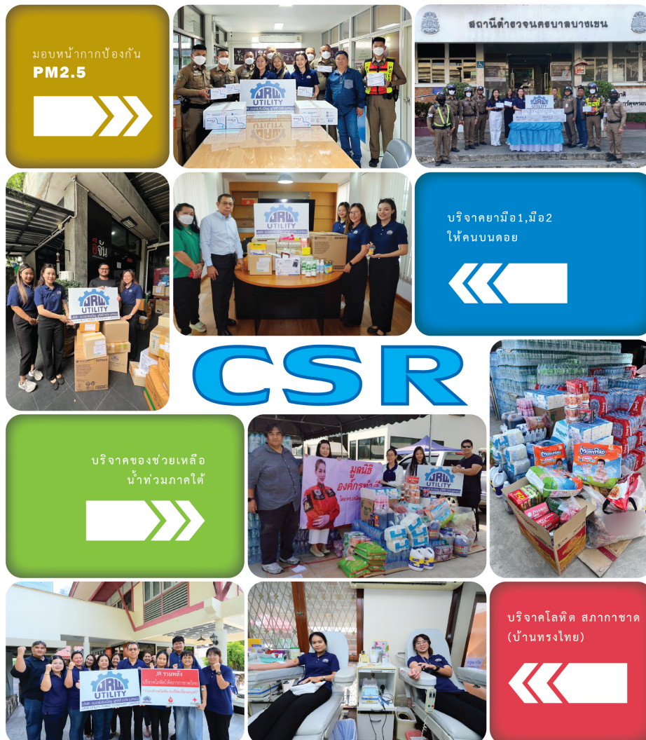
ส่วนหนึ่งของการทำ CSR ของ JRW