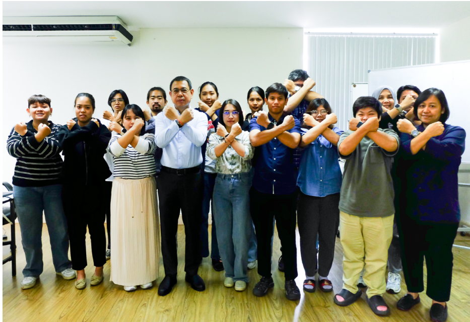
อบรมจรรยาบรรณและการต่อต้านทุจริตคอร์รัปชัน